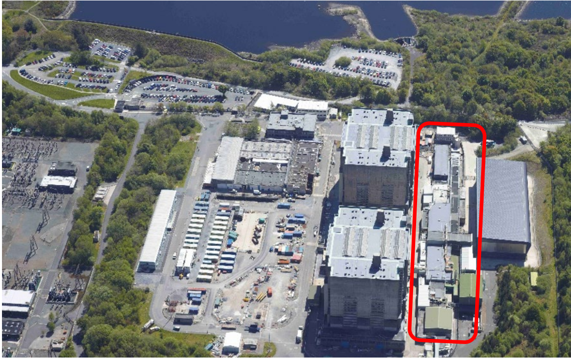
Ffigwr 1 – Golygfa o'r awyr o'r safle yn dangos lleoliad Cyfadeiladau y Pyllau (mewn coch)